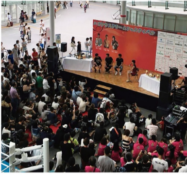
ハピテラスドリームフェスティバル

県都に福井の夢を結集し、希望ある未来・成長の核を創ります。福井を成長させる起業家・創業者を支援する戦略を構築します。