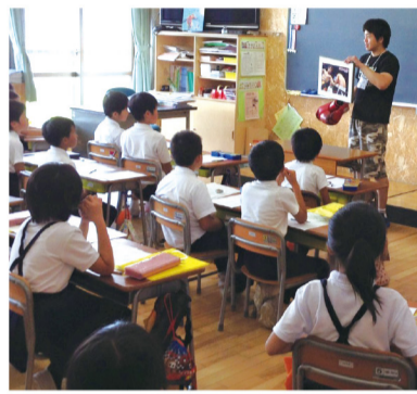
中藤小学校で「総合」の授業

夢を目指す熱い人との出会い・夢を叶えるための情熱の大切さを伝えます。一人ひとりの子どもたちの能力を引き出し、夢を叶えるための教育を実現します。