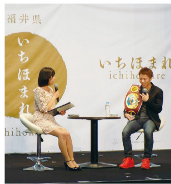
いちほまれ誕生祭

福井の知名度とブランド力を高め、U・イターンの促進や観光誘客の拡大に繋がります。福井の若者のアイデアを聞き、若い世代の感性を福井の知名度を高めるPRに取り入れていきます。