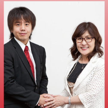
衆議院議員 稲田朋美先生と