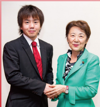
参議院議員 山谷えり子先生と