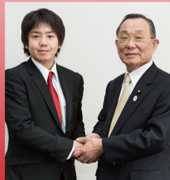
参議院議員 山崎正昭先生と